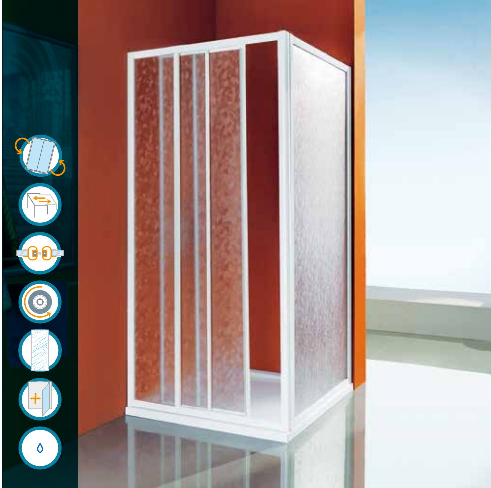
Porta scorrevole a tre ante, apertura laterale ad ante scorrevoli, una fissa e due apribili.